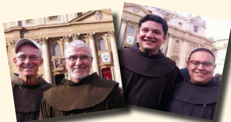
Bracia Mniejsi uczestniczący we Mszy św. na zakończenie Nadzwyczajnego Jubileuszu Miłosierdzia (20.XI.2016).